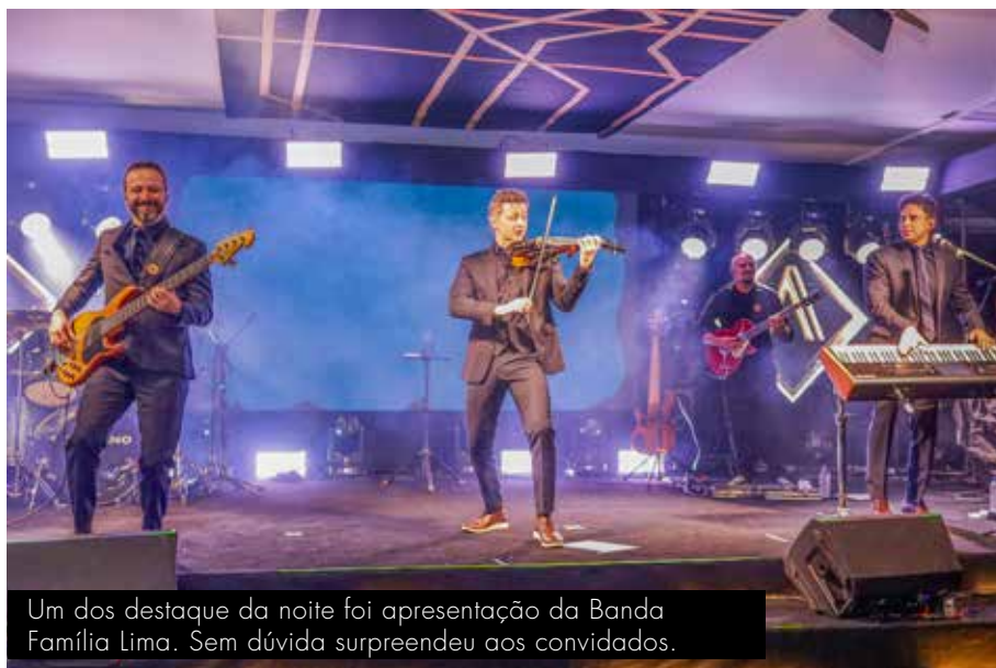
Um dos destaques da noite foi a apresentação da Banda Família Lima. Sem dúvida surpreendeu aos convidados.

Este momento especial enfatizou o compromisso contínuo da empresa com a excelência, a inovação e a gratidão, pilares que seguirão guiando seu caminho rumo ao futuro.